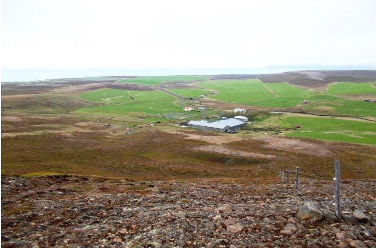
Horft ofan af Núp yfir uppgrædda mela í nágrenni Daðastaða

Árið 2001 var girt stór landgræðslugirðing í landi Daðastaða eða um 10,5 km að lengd. Frá og með 2006 hefur verið dreift 10 tonnum af áburði og 100 kg af fræi á uppgræðsluvæði í Daðastaðalandi. Húsdýraáburður hefur einnig verið notaður til uppgræðslu og sauðfé og hrossum gefið úti á melum á vorin og haustin. Hefur það skilað góðum árangri. Lögð er áhersla á að loka rofabörðum og búið er að ýta niður og græða upp nokkra kílómetra af þeim. Lúpína hefur einnig verið notuð til uppgræðslu og beitar.