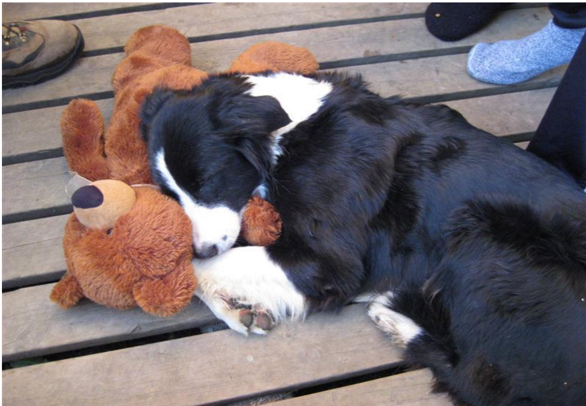
Píla hvílir lúin bein eftir erfiði helgarinnar

Vel viðraði á smala í fyrstu göngum í Núpasveit þetta haustið. Síðastliðinn föstudag var haldið upp í heiði í blíðskaparveðri björtu og stillu og höfðu menn áhyggjur að því að veðrið væri jafnvel of gott. Það þykknaði þó upp þegar komið var upp í Kálfafjöll og dropaði nánast það sem eftir var dags. Annars var hlýtt og rigndi aldrei þannig að grípa þyrfti til regnfata. Þetta var því ákjósanlegasta veður.