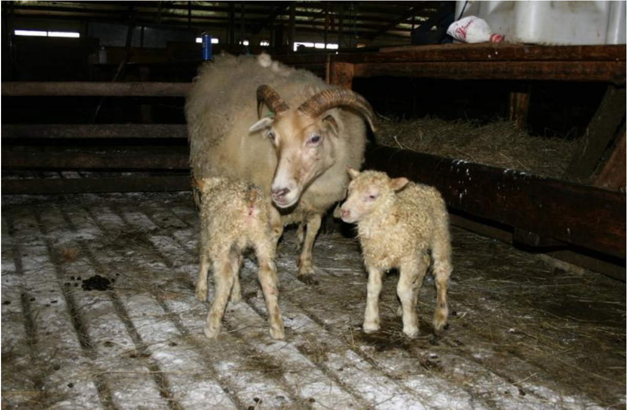
Höfundur færslu: Elísabet Gunnarsdóttir (Lísa)