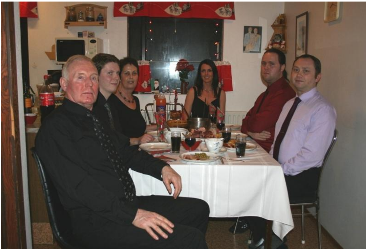
Fjölskyldan á Daðastöðum saman komin, að Óla undanskildum, sem heldur jólin hátíðleg með sinni fjölskyldu á Ak.

Jólakveðja frá fjölskyldunni á Daðastöðum